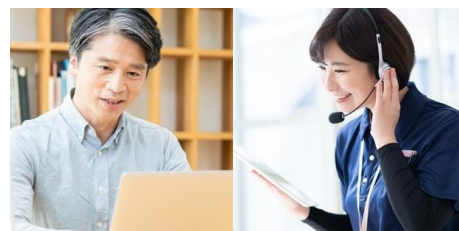
ZoomおよびZoom(ロゴ)は、Zoom Video Communications, Inc. の米国およびその他の国における登録商標または商標です。

保健師・看護師・管理栄養士などの有資格者が、3か月間あなた専属で担当します。 ご自身の状況に応じて、無理なく続けられる生活習慣改善プランをご提案します。 面談は全てオンライン会議ツール「Zoom」を利用するため、ご家庭からゆったりご参加いただけます。※Zoom面談は、積極的支援3回・動機付け支援2回のみ